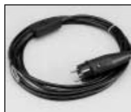
L4.79444.E Mains cable with Schuko plug Netzkabel mit Schuko Stecker