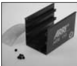
L4.79368NE Bottom part NRTL grey (from ser.nr. 20465) Unterteil NRTL grau (ab Ser.Nr. 20465)