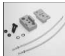
L4.79377.E GX6,35 230V Lampholder from ser.no. 20948 for lampholders before please order L4.79372.E and retrofit to improved version Lampenfassung ab Ser.Nr. 20948 für frühere Scheinwerfer bestellen Sie bitte L4.79372.E um eine verbesserte Version zu ermöglichen