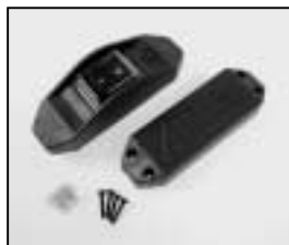
L4.77157.E Inline switch only USA UL Schnurschalter USA UL