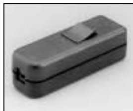
L4.79477.E Inline switch only Schnurschalter