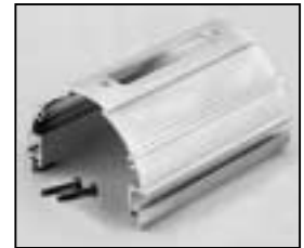
L4.79363.E Extrusion top silver Rippenblech oben silber