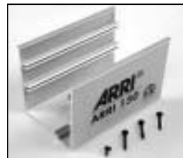
L4.79367NE Bottom part NRTL silver (from ser.nr. 20465) Unterteil NRTL silber (ab Ser.Nr. 20465)