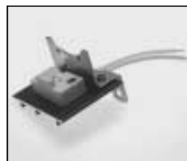
L4.79372.E * Lampholder + lamp carriage Lampenfassung + Fassungsträger GX 6,35 230V