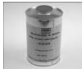
L4.70186.E Paint thinner Farb-Verdünnung