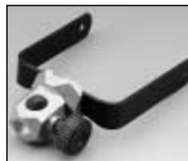
L4.79375.E Stirrup complete Haltebügel komplett