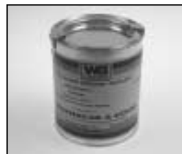
L4.70185.E Paint grey similar RAL 7024 Lack grau ähnlich RAL 7024