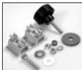
L4.79378.E Mounting set for stirrup Bügelbefestigungssatz