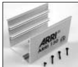
L4.79367UE Bottom part ETL silver (to ser.nr. 20463) Unterteil ETL silber (bis Ser.Nr. 20463)