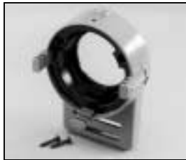
L4.79362.E Front casting blue Frontteil blau

NOTE: WHEN ORDERING QUOTE PART NUMBER BEMERKUNG: BEI BESTELLUNG IDENT.-NR. ANGEBEN