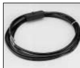
L4.79476.E Mains cable without plug Netzkabel ohne Stecker