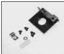
L4.79403.E Lamp carriage Fassungsträger B 15 d 120 V