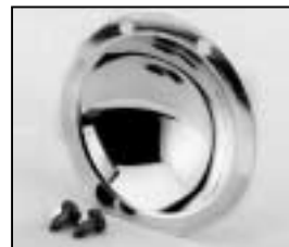
L4.79386.E Reflector Reflektor