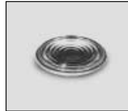
L4.72885.E Fresnel lens Stufenlinse