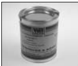
L4.70194.E Paint blue similar RAL 5015 Lack blau ähnlich RAL 5015