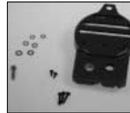
L4.79366TE Rear casting grey Rückteil grau