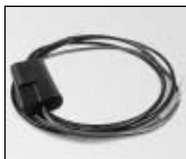
L4.79439.E Mains cable with dimmer Netzkabel mit Dimmer