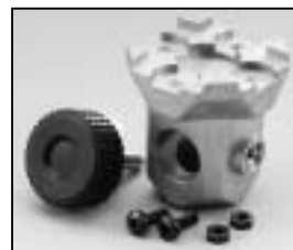
L4.79358.E 16 mm stirrup socket Hülse für Bügel