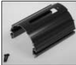
L4.79363TE Extrusion top grey Rippenblech oben grau