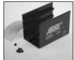
L4.79368UE Bottom part ETL grey (to ser.nr. 20463) Unterteil ETL grau (bis Ser.Nr. 20463)