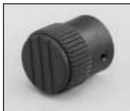
L4.79379.E Focus knob Fokusknopf