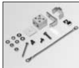
L4.79388UE Terminal block USA UL Kabelklemme USA UL