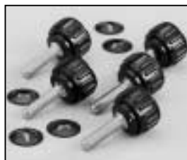
L4.79357.E Knurled-head screw 5 pieces Rändelschrauben-Set 5 Stück