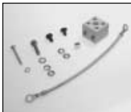
L4.79388.E Terminal block Kabelklemme