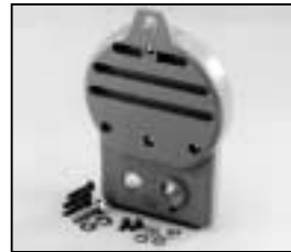
L4.79366.E Rear casting blue Rückteil blau