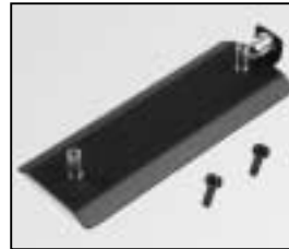
L4.79364.E Cover Abdeckblech