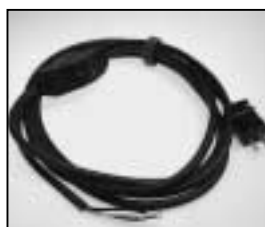
L4.79442.E Mains cable Netzkabel/USA