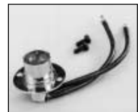
L4.79443.E Lampholder Lampenfassung B 15 d 120V

* Can be used to retrofit the new lampholder to lampholders up to ser.nr.: 20947 Ermöglicht einen Gebrauch der neuen Lampenfassung für Scheinwerfer bis zur Ser.Nr.: 20947