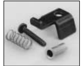
L4.79365.E Top latch Torsicherung