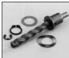
L4.79370.E Focus spindle Fokusspindel