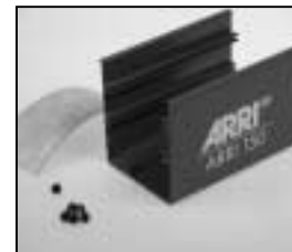
L4.79368.E Bottom part grey Unterteil grau