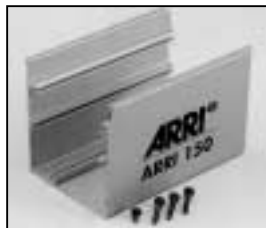
L4.79367.E Bottom part silver Unterteil silber