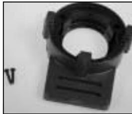
L4.79362TE Front casting grey Frontteil grau