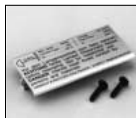
L4.79212UE Bottom plate (USA) silver Bodenblech (USA) silber