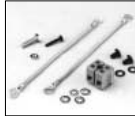
L4.79434.E Terminal block plastic Kabelklemme Kunststoff