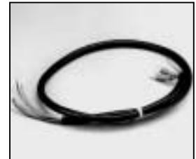
L4.79274UE (USA) Head to switch cable (USA) Kabel (bis zum Schalter) (USA)