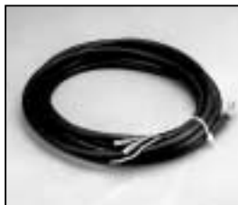
L4.79732UE Mains cable (USA) Netzkabel (USA)