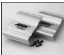
L4.79246.E Set of side panels silver Set Seitenbleche silber