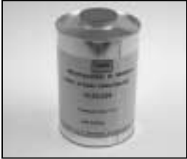
L4.70186.E Paint thinner Farb-Verdünnung