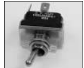
L4.85034.E On / off-switch Aus- / Einschalter