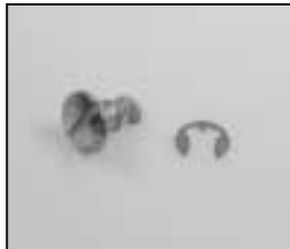
L4.85031.E Fastener assembly rear Verschluß Rückdeckel