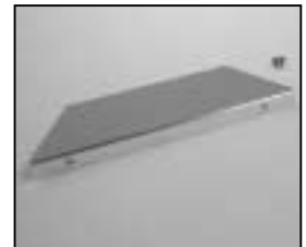
L4.85038.E Reflector front Reflektor vorne