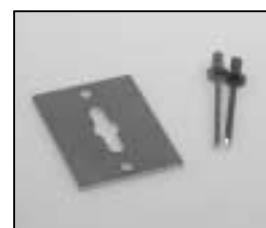
L4.85013.E p.o.-stirrup fixing set p.o.-Bügel-Aufnahme-Set