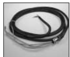
L4.85017.E Mains cable 200-240V Netzleitung 200-240V