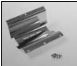
L4.85035.E Reflector bottom Reflektor unten