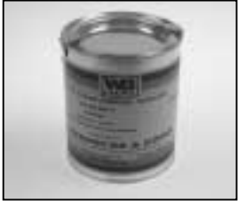
L4.70183.E Paint black similar RAL 9011 Lack schwarz ähnlich RAL 9011