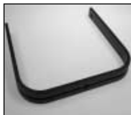
L4.80455.E Stirrup man. Bügel man.