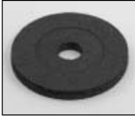
L4.83153.E Friction disc Friktionsscheibe