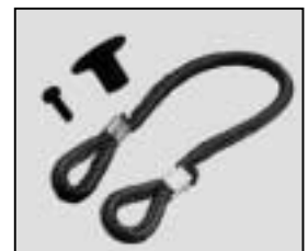
L4.79242.E Cable tie-set Halteleinen-Set