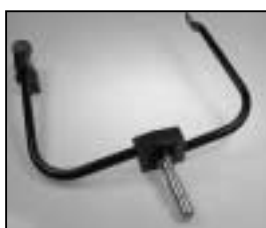
L4.83137.E p.o. - stirrup p.o. - Bügel