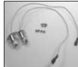
L4.85033.E Lampholder left & right Lampenfassung links&rechts