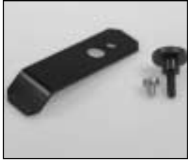
L4.85018.E Top latch Torsicherung