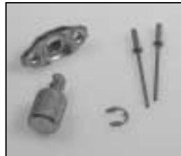
L4.85032.E Fastener assembly housing Verschluß Lampengehäuse