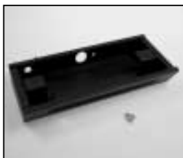
L4.85039.E Wiring trough black Bodenwanne