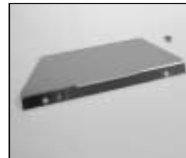
L4.85037.E Reflector back Reflektor hinten