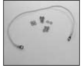
L4.85025.E Connecting wires Verbindungsleitungen