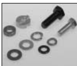
L4.85028.E Stirrup mounting set p.o. Bügelbefestigungs-Set p.o.