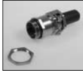
L4.85050.E Strain relief Kabelverschraubung