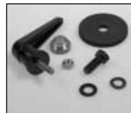
L4.85027.E Stirrup mounting set man. Bügel Befestigungsset man.