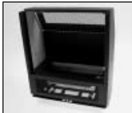
L4.85030.E Housing black incl. fastener Gehäuse schwarz inkl. Verschlüsse

NOTE: WHEN ORDERING QUOTE PART NUMBER BEMERKUNG: BEI BESTELLUNG IDENT.-NR. ANGEBEN