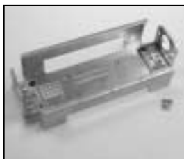
L4.85040.E Socket assembly Lampensockel