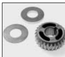
L4.85103.E Worm gear Schneckenrad