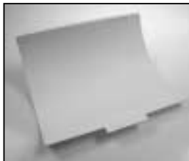
L4.85042.E Reflector white Reflektor weiß