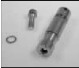
L4.80104.E Aufhängezapfen Spigot