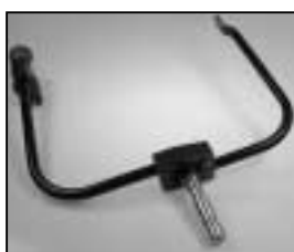
L4.83085.E p.o. - stirrup p.o. - Bügel