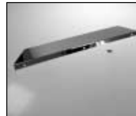
L4.85046.E Reflector back Reflektor hinten