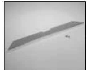
L4.85047.E Reflector front Reflektor vorne