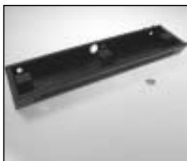
L4.85048.E Wiring trough black Bodenwanne