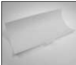
L4.85049.E Reflector white Reflektor weiß