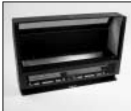
L4.85045.E Housing black incl. fastener Gehäuse schwarz inkl. Verschlüsse

NOTE: WHEN ORDERING QUOTE PART NUMBER BEMERKUNG: BEI BESTELLUNG IDENT.-NR. ANGEBEN