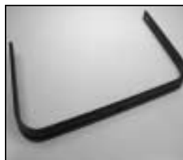
L4.85026.E Stirrup man. Bügel man.