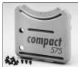
L4.73836.E Base casting, front to ser. no. 733/94 Wannenstirnseite, vorne bis Ser. Nr. 733/94