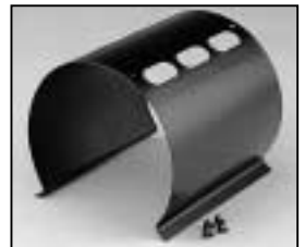
L4.73789.E to ser. no. 1758 / bis Ser. Nr. 1758 Internal side baffle/Mantelstromblech