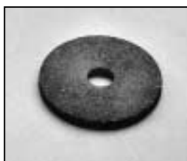
L4.83153.E Friction disc Friktionsscheibe