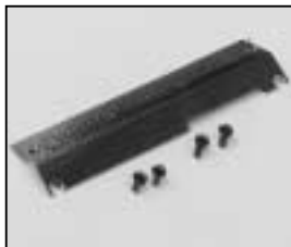
L4.73865.E to ser. no. 733 / bis Ser. Nr. 733 Internal baffle, top Mantelstromblech oben