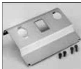
L4.73989.E Internal side baffle left from ser. no. 734/94 Mantelstromblech links ab Ser. Nr. 734/94