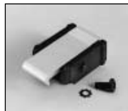
L4.79747.E Door catch set Schnapphaken-Set