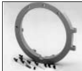
L4.79687.E from ser. no. 1759/ab Ser. Nr. 1759 Front casting / Frontteil