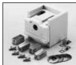
L4.73824.E Lamp holder complete Lampenfassung komplett