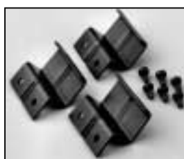
L4.79744.E Accessory bracket man. Halteklau man.