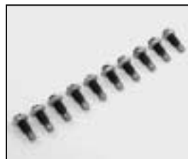
L4.80122.E 10 pcs. guide roll / focus 10 St. Führungsrollen / Fokus