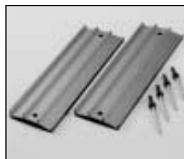
L4.73788.E to ser. no. 1758 / bis Ser. Nr. 1758 Extrusions, top Rippenbleche oben