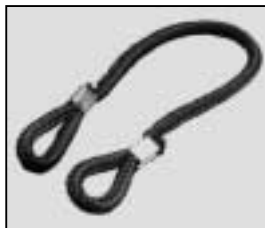
L4.79855.E Cable tie Halteleine