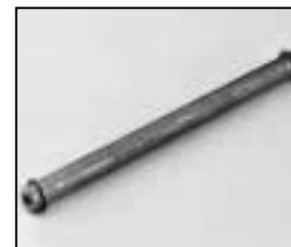
L4.73840.E Guide rail Leitspindel