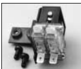
L4.73851.E Safety switch complete Endschalter komplett