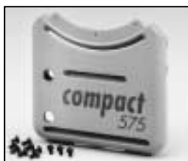
L4.73942.E Base casting, front from ser. no. 734/94 Wannenstirnseite, vorne ab Ser. Nr. 734/94