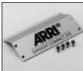
L4.73838.E Side panel left or right Seitenblech links oder rechts