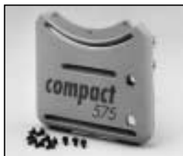
L4.73837.E Base casting, rear to ser. no. 733/94 Wannenstirnseite, hinten bis Ser. Nr. 733/94