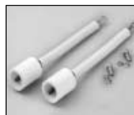
L4.73445.E H.T. cables complete Lampenkabel komplett