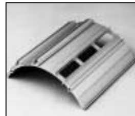
L4.79625.E from ser. no. 1759/ab Ser. Nr. 1759 Side extrusion compl./ri./le. / Rippenblech kpl./re./li.