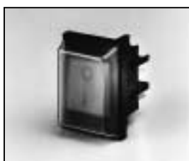
L4.72826.E On/Off switch Wippschalter