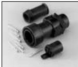
L4.75602.E Schaltbau connector (male) with coupling ring Schaltbau Stecker (Stiftkontakt) mit Überwurfmutter