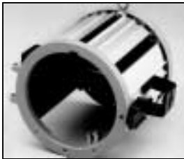
L4.73785.E to ser. no. 1758 / bis Ser. Nr. 1758 Housing compl. / Gehäuse kpl.

NOTE: WHEN ORDERING QUOTE PART NUMBER BEMERKUNG: BEI BESTELLUNG IDENT.-NR. ANGEBEN