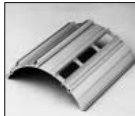
L4.73794.E to ser. no. 1758 / bis Ser. Nr. 1758 Side extrusion left/Rippenblech links