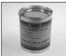
L4.70194.E Paint blue similar RAL 5015 Lack blau ähnlich RAL 5015