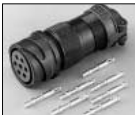
L4.71876.E Veam connector (female) Veam Stecker (Buchsenkontakt)