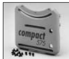
L4.73943.E Base casting, rear from ser. no. 734/94 Wannenstirnseite, hinten ab Ser. Nr. 734/94