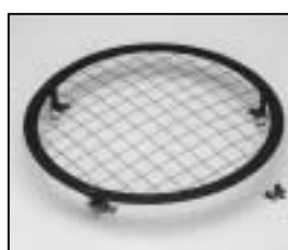
L4.79728.E Wire guard Schutzgitter