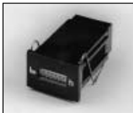
L4.77678.E Hour counter elec. 20/100 Hz from ser. no. 734/94 Betriebsstundenzähler elektr. 20/100 Hz ab Ser. Nr. 734/94