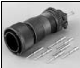
L4.71874.E Veam connector (male) Veam Stecker (Stiftkontakt)