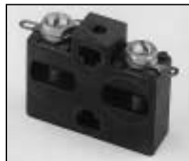
L4.75787.E Spark gap Funkenstrecke