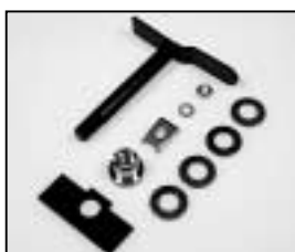
L4.73817.E Lamp lock shaft Hebel geschweißt