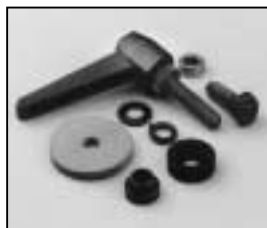
L4.79273.E Stirrup mounting set Bügelbefestigungs-Set