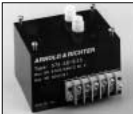
L4.73834.E Ignitor Zündgerät