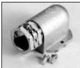
L4.73474.E Screw-type conduit fitting to ser. no. 2481/bis Ser. Nr. 2481 Kabelverschraubung