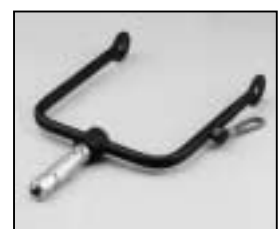
L4.73853.E Stirrup man. Haltebügel man.