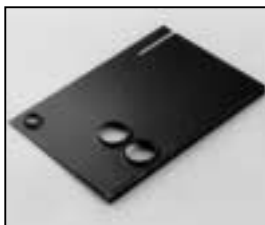
L4.73864.E Cover Abdeckblech