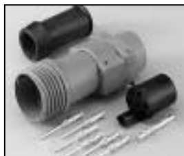
L4.75603.E Schaltbau connector (female) with- out coupling ring Schaltbau Stecker (Buchsenkontakt) ohne Überwurf- mutter