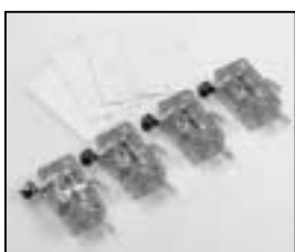
L4.72587.E 4 pcs. safety switch 4 St. Sicherheitsschalter