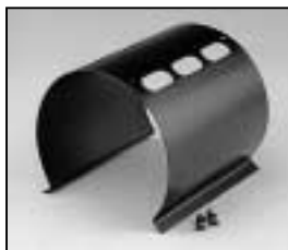
L4.79622.E from ser. no. 1759/ab Ser. Nr. 1759 Internal side baffle/Mantelstromblech