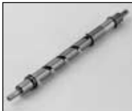
L4.73839.E Focus spindle man. Fokusspindel man.