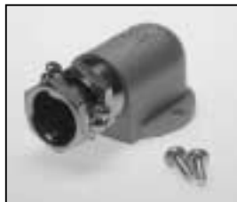
L4.73617.E Screw-type conduit fitting new from ser. no. 2482/ab Ser. Nr. 2482 Kabelverschraubung neu