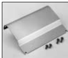
L4.73845.E Internal side baffle right from ser. no. 734/94 Mantelstromblech rechts ab Ser. Nr. 734/94