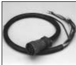
L4.76006.E Mains cable (Schaltbau) "German TV" with coupling ring Scheinwerferkabel (Schaltbau) "Deutsche Fernsehnorm" mit Überwurfmutter