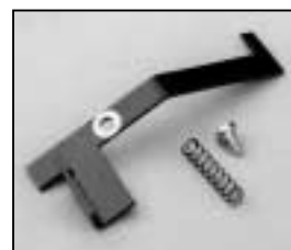
L4.73848.E Safety switch activator Klinke für Endschalter