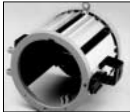
L4.79686.E from ser. no. 1759/ab Ser. Nr. 1759 Housing compl. / Gehäuse kpl.