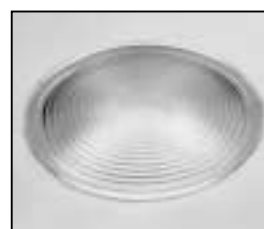
L4.79572.E Fresnel lens Stufenlinse