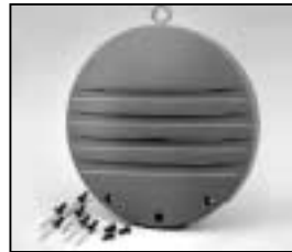
L4.73787.E to ser. no. 1758 / bis Ser. Nr. 1758 Rear casting / Rückteil