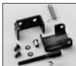
L4.73796.E Top latch man. Torsicherung man.