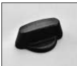
L4.81380.E Focus knob Fokusknopf