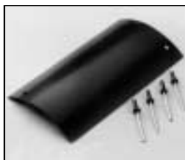
L4.73790.E to ser. no. 1758 / bis Ser. Nr. 1758 Top cover Abdeckung oben