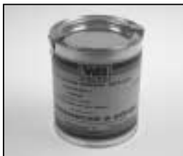
L4.70183.E Paint black similar RAL 9011 Lack schwarz ähnlich RAL 9011