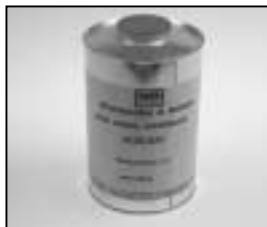
L4.70186.E Paint thinner Farb-Verdünnung