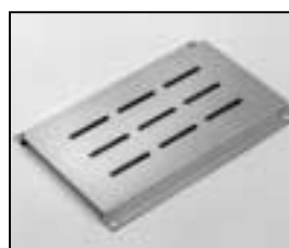
L4.73841.E Bottom panel to ser. no. 733/94 Bodenblech bis Ser. Nr. 733/94