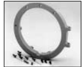
L4.73786.E to ser. no. 1758 / bis Ser. Nr. 1758 Front casting / Frontteil