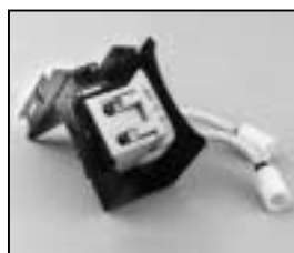
L4.73859.E Lamp holder + lamp carriage Lampenfassung + Fokusschlitten