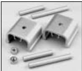
L4.74388.E from ser. no. 1759/ab Ser. Nr. 1759 Stirrup bracket Büggelager