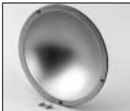
L4.79743.E Reflector Reflektor