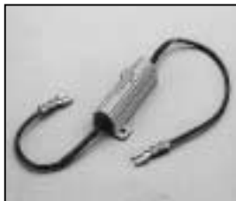
L4.73455.E Compensating resistance for electronic hour counter Vorwiderstand komplett für elektr. Betriebsstundenzähler