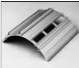
L4.73792.E to ser. no. 1758 / bis Ser. Nr. 1758 Side extrusion right Rippenblech rechts