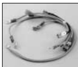
L4.73480.E Connecting wire Verbindungsleitern