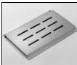
L4.73987.E Bottom panel from ser. no. 734/94 Bodenblech ab Ser. Nr. 734/94