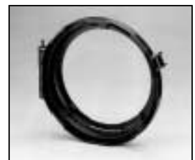
L4.79573.E Lens door Linsenfassung