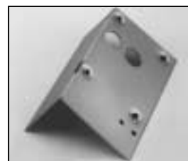
L4.73944.E Intermediate panel from ser. no. 734/94 Zwischenblech ab Ser. Nr. 734/94