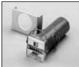
L4.73448.E Hour counter elec. 50/60 Hz to ser. no. 733/94 Betriebsstundenzähler elektr. 50/60 Hz bis Ser. Nr. 733/94