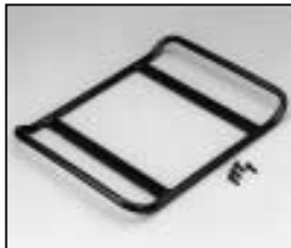
L4.73856.E Base skid Kufe