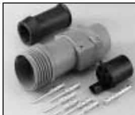
L4.75605.E Schaltbau connector (male) without coupling ring Schaltbau Stecker (Stiftkontakt) ohne Überwurf- mutter