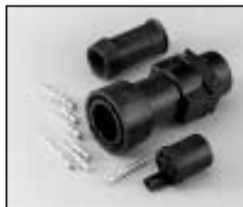
L4.75604.E Schaltbau connector (female) with coupling ring Schaltbau Stecker (Buchsenkontakt) mit Überwurf- mutter